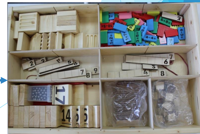
Развивающий набор психолога