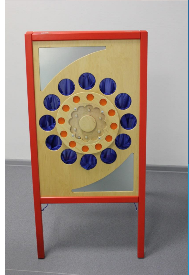
Коррекционно – развивающий куб