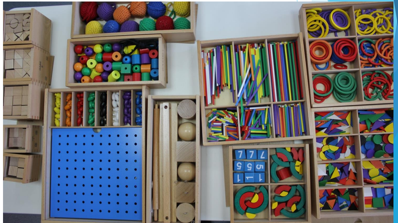
Развивающий набор дары Фребеля