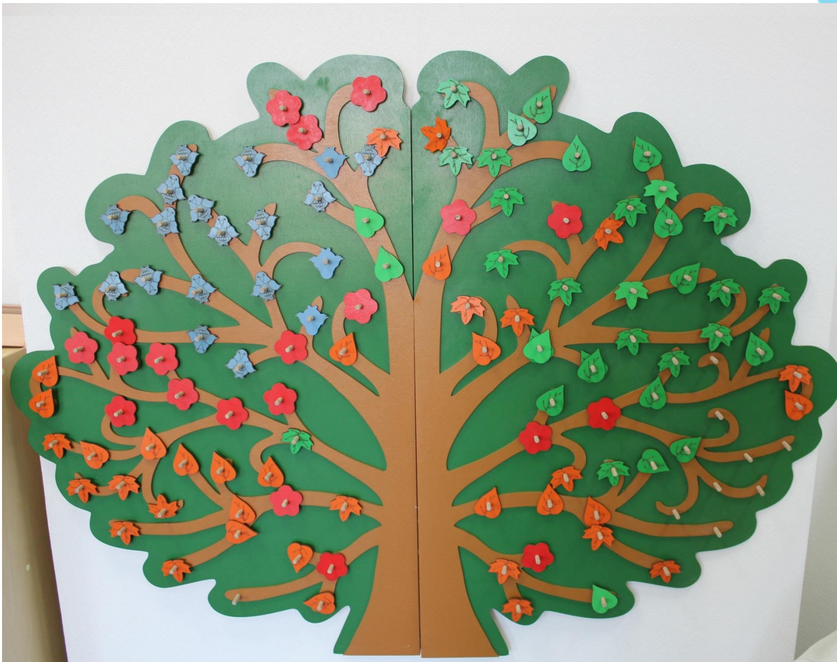
Коррекционно – развивающее дерево