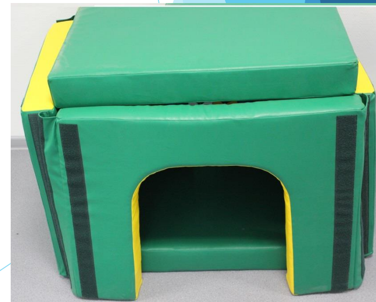
Оборудование для релаксации и снятия напряжения