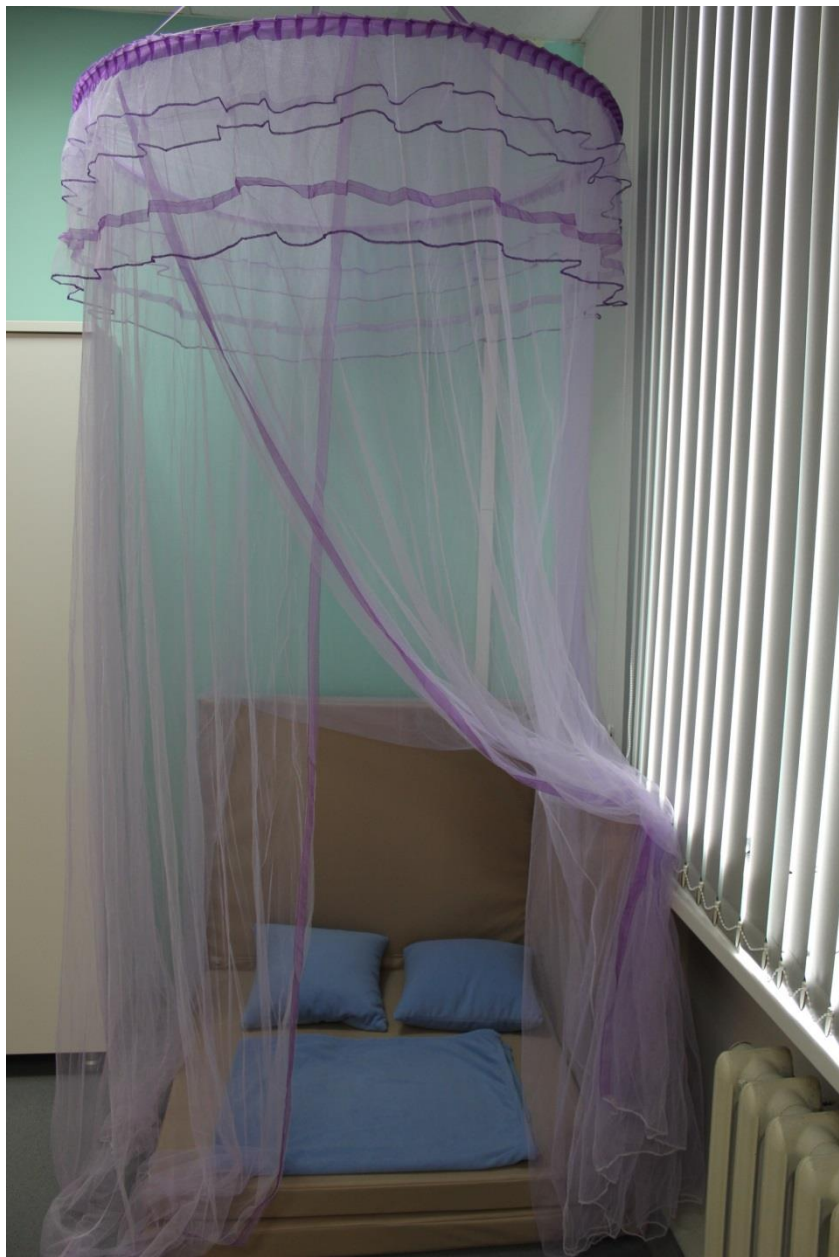
Уютный уголок для релаксации